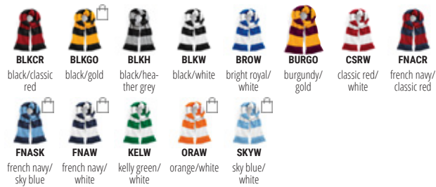
B479 Stadium Scarf 100% acrilico soft-touch. Sciarpa in tessuto in maglia a costine su ambo i lati, estremità con frangie. Dimensioni: 182 x 18 cm.